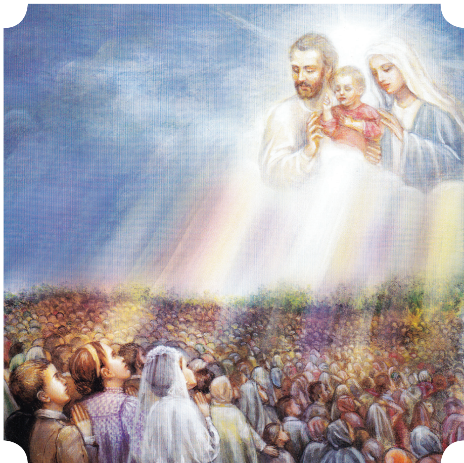
El Divino Niño y San José bendicen al mundo - 13.10.1917 - Milagro del Sol

fuera revelado en 1960 “porque entonces será más claro” .