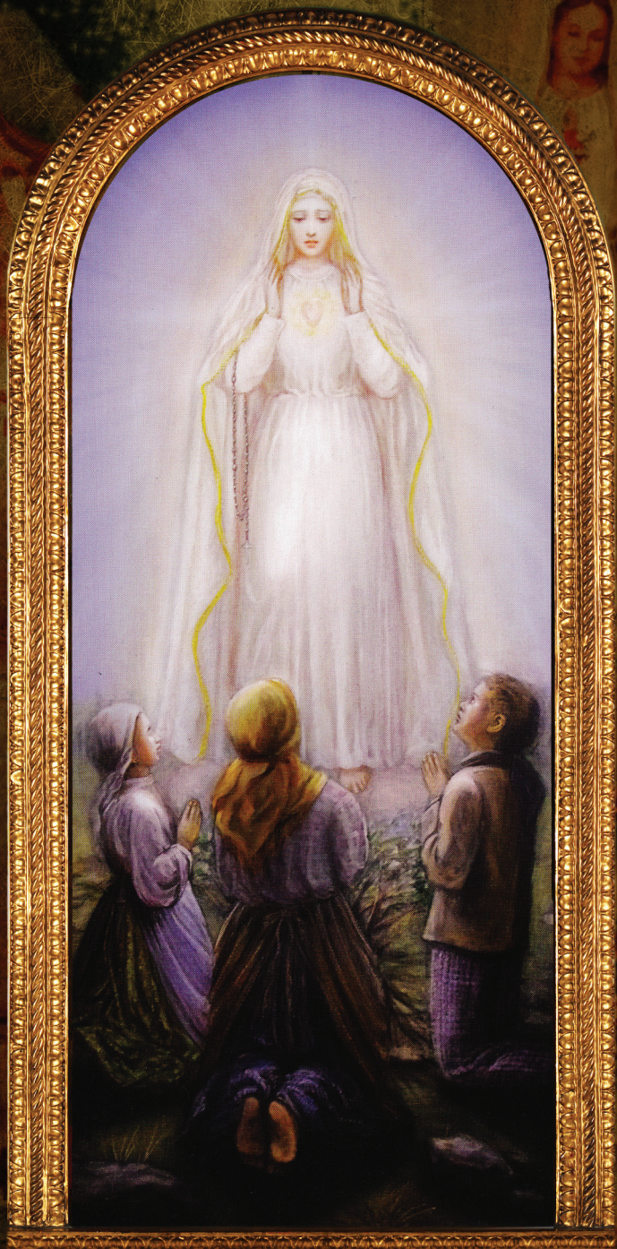
Beata Virgo Maria de Fatima