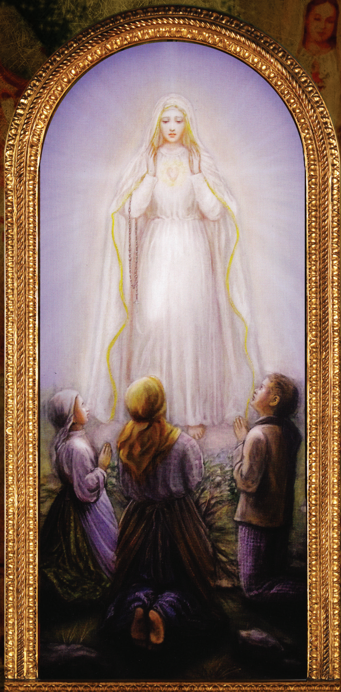
Beata Virgo Maria de Fatima